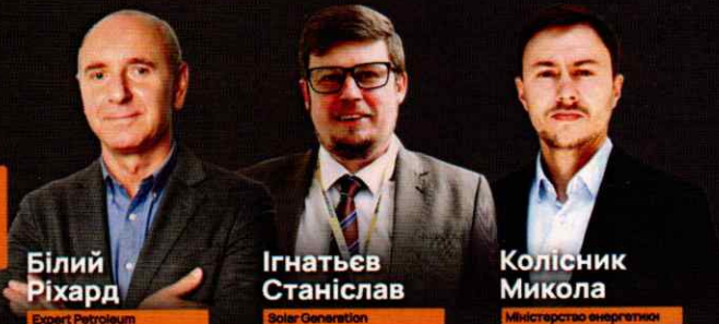
Білий Ріхард Expert Petroleum