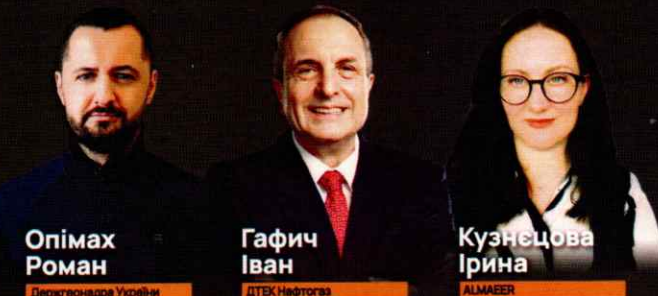
Опімах Роман Держгеонадра України